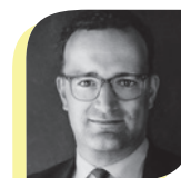
Jens Spahn, MdB